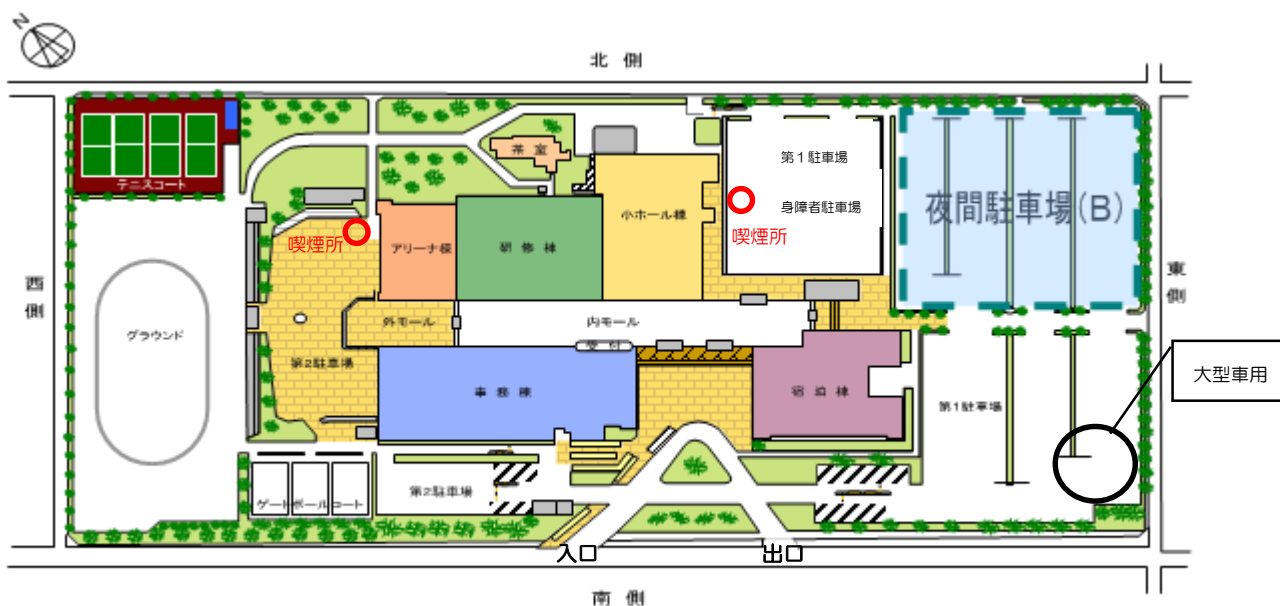
埼玉県県民活動総合センター 配置図